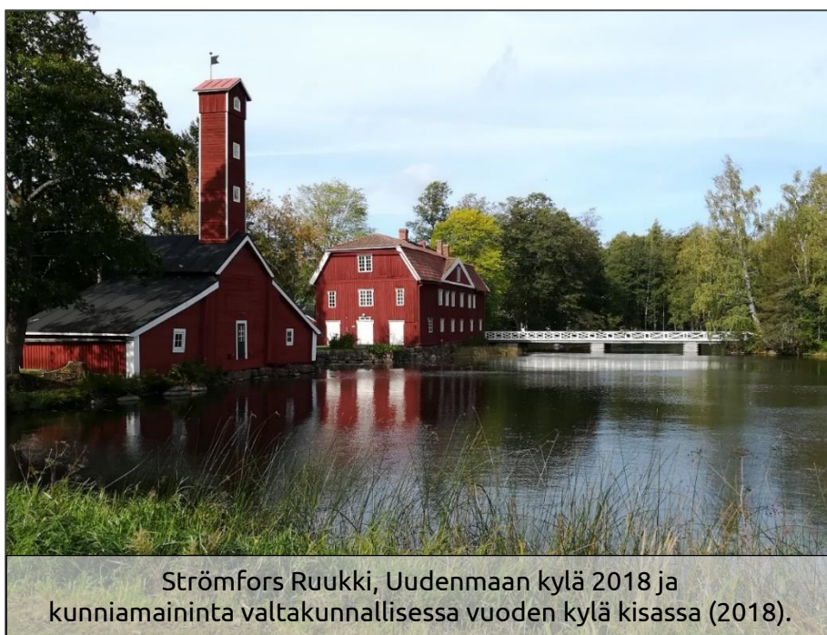
Strömfors Ruukki, Uudenmaan kylä 2018 ja kunniamaininta valtakunnallisessa vuoden kylä kisassa (2018).